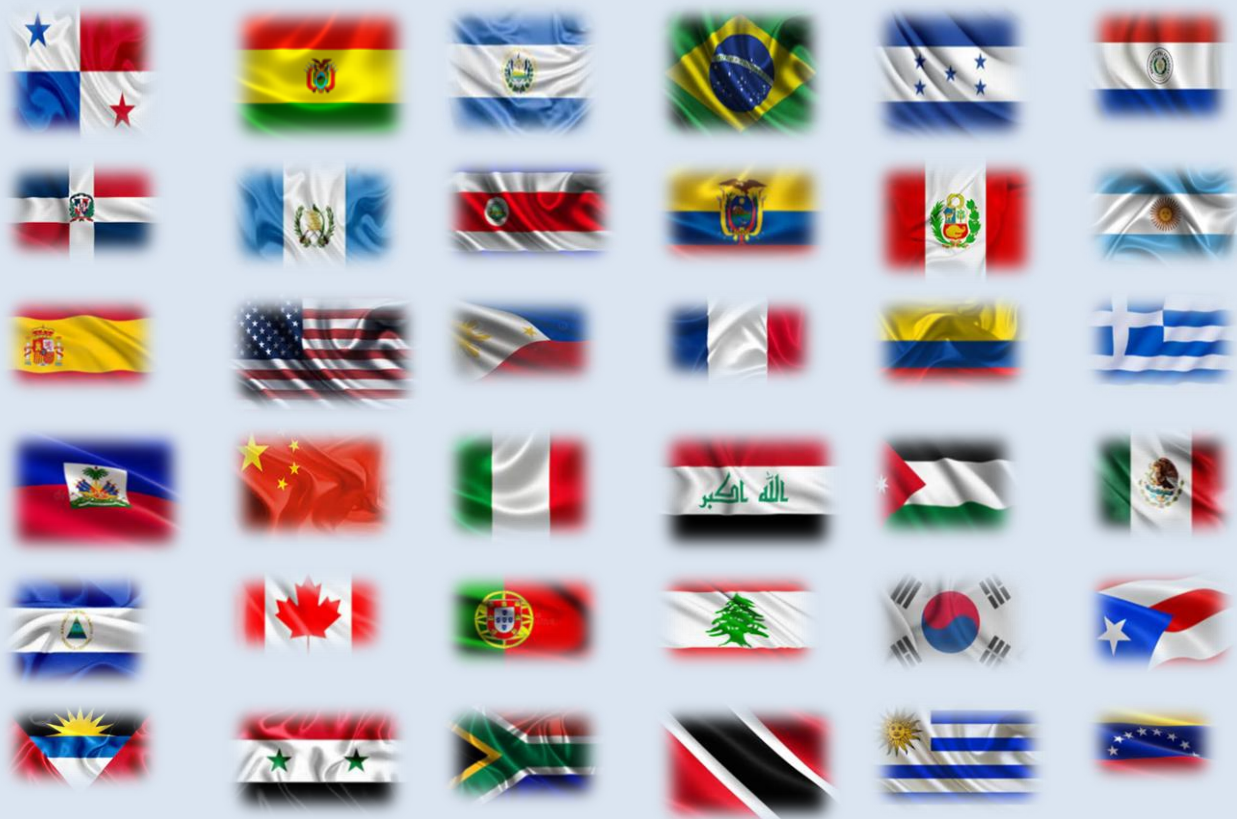
(Países que han participado del Programa Cecipu)

La Secretaría Ejecutiva del Programa de becas del Gobierno de Chile (CECIPIU) es la responsable de ejecutar los procesos de difusión, postulación y selección de los policías extranjeros oponentes a las becas, supervisar su desempeño académico y comportamiento profesional.